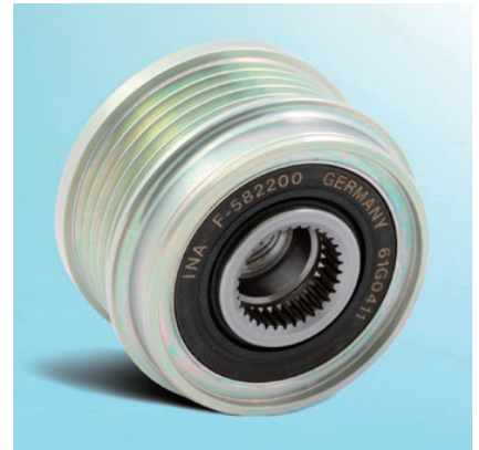
画像 2：アフターマーケットバージョン

上記の型式には 2 つの異なるバージョンのオーバーランニングオルタネータープーリーを取り付けることができます。