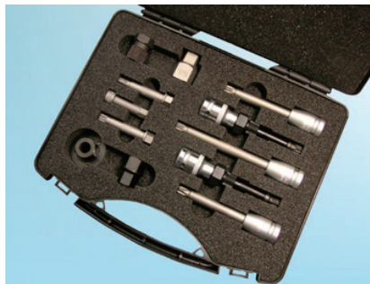
画像 3：INA 専用工具、 部品番号 400 0241 10

2 つのオーバーランニングオルタネータープーリーは技術要件に完全に準拠しており、外観のみが異なります。